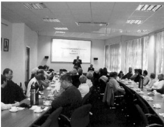
Die Gruppe der CDU im Innenministerium mit Staatssekretär Peter Altmaier.